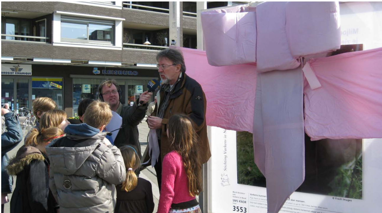
Kinderboekenschrijver Jacques Vriens opent de fototentoonstelling in Maastricht

Er was veel belangstelling van de lokale media. Duizenden mensen hebben contact gehad met onze voorlichters, tienduizenden mensen hebben de foto's bekeken en honderdduizenden mensen hebben via de lokale media gehoord over de fototentoonstelling en zijn meer te weten gekomen over het lot van varkens.