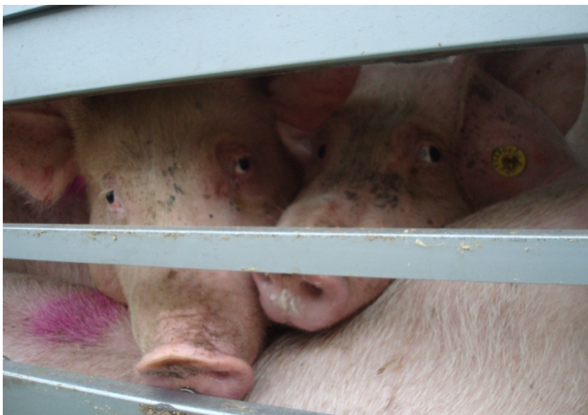
De aandacht voor dierwaardige veetransporten is toegenomen.

Als gevolg van alle incidenten met veetransporten hebben twee belangenorganisaties, de Ondernemersorganisatie voor Logistiek en Transport EVO, met 30.000 leden en Veetrans, vereniging voor vervoerders en handelaren van vee, een nieuwe organisatie opgezet. Ze beogen maatschappelijk verantwoord transport van dieren verder te verankeren.