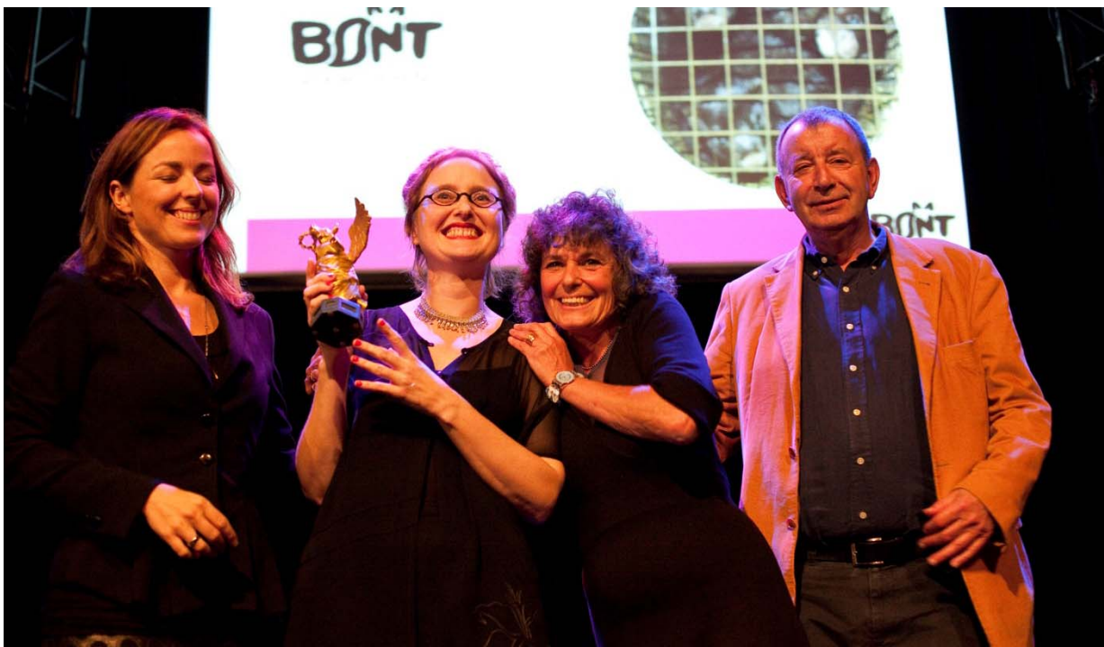
Bont voor Dieren won de Gouden Koe voor haar campagne tegen de nertsenfokkerij.