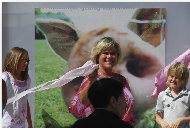
Dierenvriend en boegbeeld van de TROS Ellen Brusse opent de fototentoonstelling in Rotterdam, Museumpark