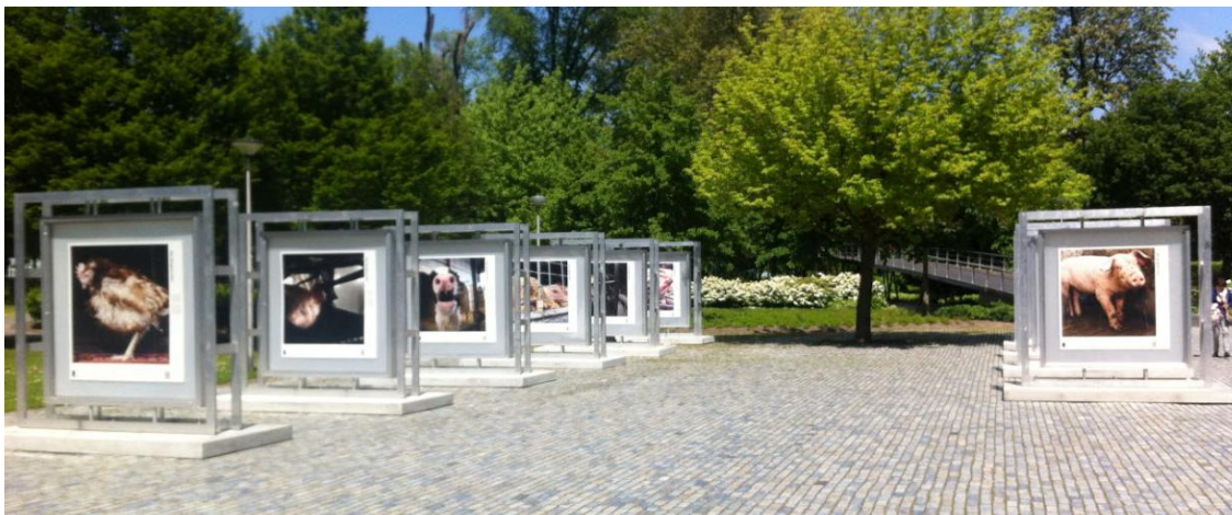
Fototentoonstelling Rotterdam, Museumpark

In 2012 werden de voorbereidingen getroffen voor een nieuwe fototentoonstelling, dit keer niet alleen over varkens, maar over de vee-industrie in zijn geheel. De vorige fototentoonstelling, 'Varkens, je ziet ze niet maar ze zijn er wel' was tussen 2009 en 2011 in bijna 20 plaatsen in Nederland te zien.