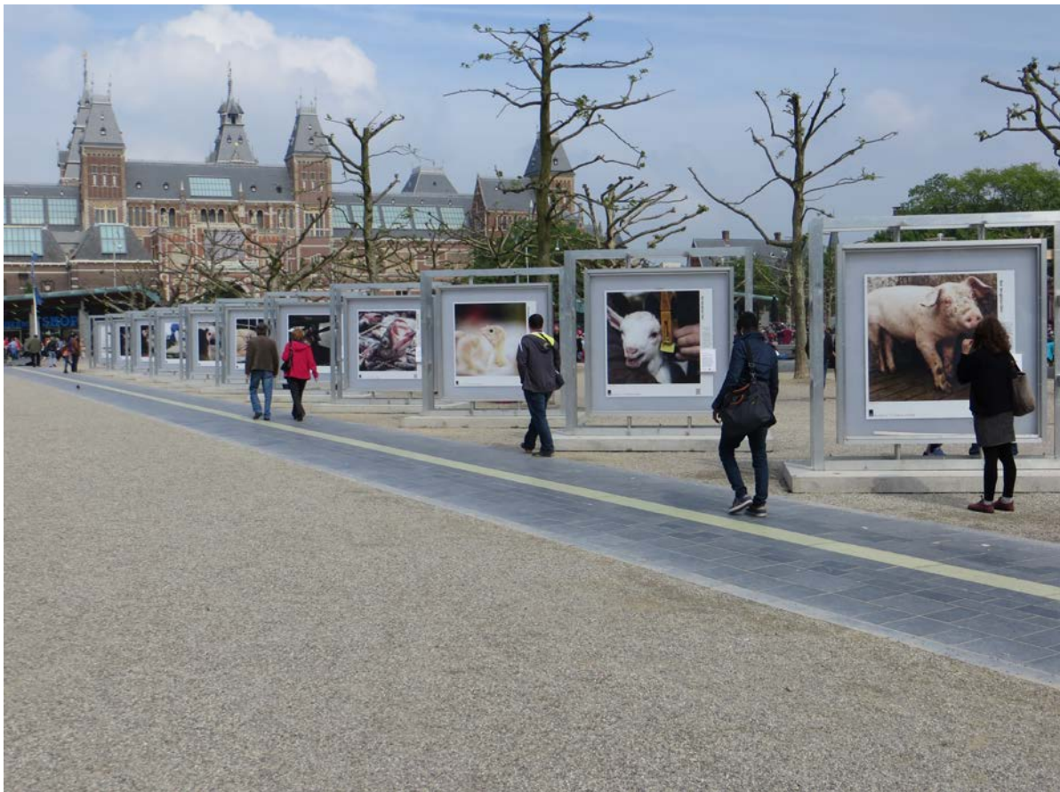
Fototentoonstelling Amsterdam, Museumplein en hieronder in Den Haag