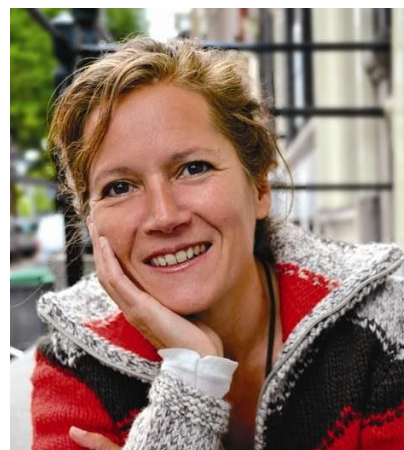
Bibi Dumon Tak

Bibi heeft met haar jeugdboeken viermaal de Zilveren Griffel