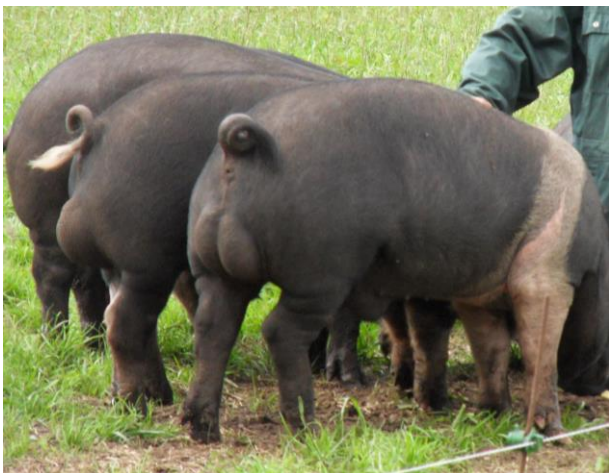
Varkens met ballen, zo hoort het!

In de afgelopen jaren werden in Nederland en de ons omringende landen veel minder biggen gecastreerd. Tussen 2010 en 2015 zijn dankzij acties van Varkens in Nood tegen de 100 miljoen varkens de castratie ontsprongen. Sinds enige tijd voert de Nederlandse industriële varkenssector zelf actie om de rest van de EU ook te laten stoppen.