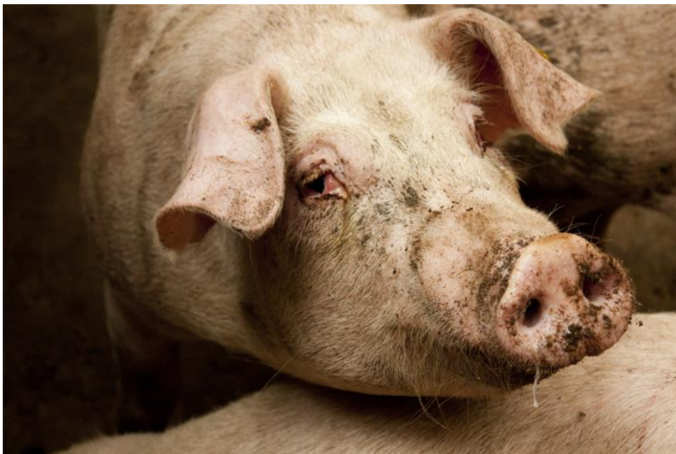
Varken met ontstoken ogen, veroorzaakt door een slecht stalklimaat.

De Nederlandse varkensbedrijven hebben wettelijk verplicht allemaal een luchtwasser om de smerige en met ammoniak vervuilde lucht van mest en urine, te zuiveren. Voordat het de omgeving in gaat wel te verstaan, niet in de stallen. De varkens staan permanent in deze smerige lucht en hebben massaal longontstekingen en pleuritis. In 2015 werd een vordering bij de Nederlandse Voedsel en Warenautoriteit ingediend om handhavend op te treden in het geval de stallucht zo vervuild is dat dit de gezondheid van varkens aantast (dit geldt voor zeker 50% van de stallen).