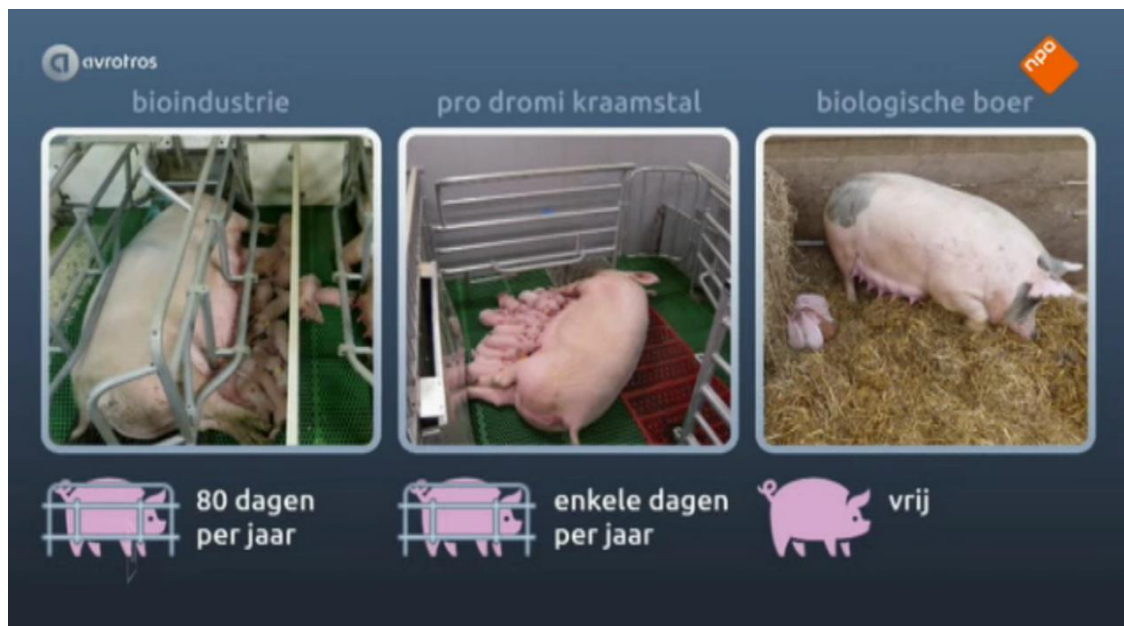
De Pro Dromi-kraamstal, hier in EenVandaag, is een grote welzijnsverbetering in vergelijking met de reguliere kraamkooi. Biologisch blijft het beste voor het welzijn van de zeug.

Reden genoeg om een nieuwe campagne te beginnen. Onze eis: binnen 10 jaar een volledig verbod op de kraamkooi. Dankzij onze inspanningen werden er Kamervragen gesteld door SP en D66. Ook adviseerde staatssecretaris Dijkema samen met haar Duitse, Deense en Zweedse collega's de Europese Commissie om de EU-richtlijn over varkenswelzijn aan te passen. Daarin worden ook de ontwikkelingen op het gebied van de kraamstal genoemd. Ons doel is nog niet bereikt, deze campagne duurt dan ook voort in 2016.