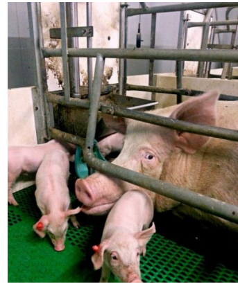
Een moedervarken kan door de kraamkooi niet voor haar biggen zorgen. Dit veroorzaakt ernstige stress en kan zelfs een hartaanval tot gevolg hebben.

Groepshuisvesting voor zeugen (moedervarkens) is gelukkig in heel Europa sinds 2013 wettelijk voorgeschreven. Helaas is het de varkensboer nog wel toegestaan om zeugen één week voor de bevalling tot het moment dat de biggetjes worden weggehaald (spenen) in een kraamkooi vast te zetten. In de praktijk betekent dit dat de zeug, die 2,3 keer per jaar biggen werpt, 80 dagen per jaar opgesloten zit.