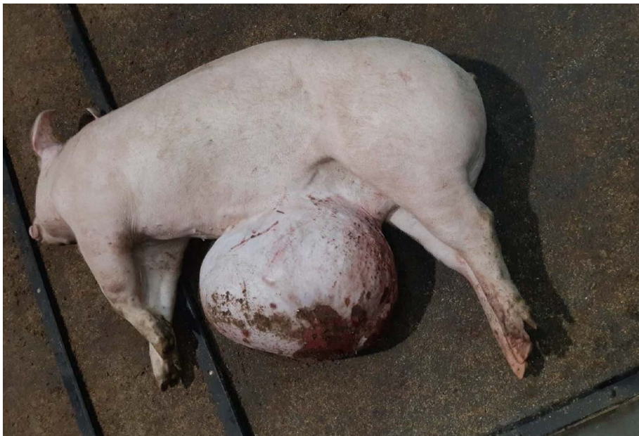
↑ Varken met extreem grote en beschadigde navelbreuk. De inspecteur omschrijft: "Ik zag dat het betreffende dier moeilijk kon lopen omdat de breuk over de vloer sleepte en het dier daarbij met de achterpoten op de breuk trapte." Woo 21-0042, 2020

Varkens met een open prolaps 5 of hernia 6 – een ontzettend pijnlijke en kwetsbare verzakking of uitstulping van de organen – worden naar het slachthuis vervoerd. In meerdere gevallen is de uitstulping zo groot dat deze over de vloer sleept of dat het varken er tijdens het lopen tegenaan schopt. Hierdoor ontstaan grote open wonden die – tot bloedens toe – steeds opnieuw beschadigen en door contact met de vuile vloer snel ontstoken raken. De rapporten laten varkens zien met open, ontstoken navelbreuken van wel 35 cm groot.