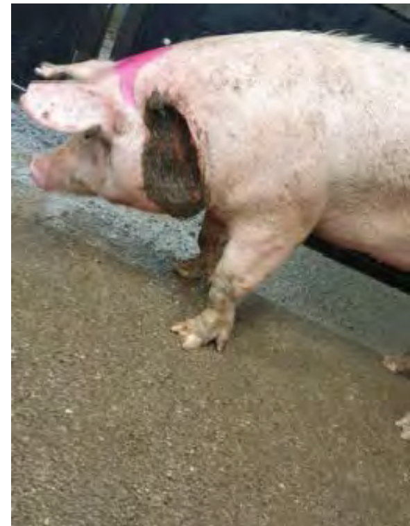
↑ Varken met een grote open wond aan de linkerzijde van de nek. De wond was ongeveer 30 cm lang en ontstoken. De inspecteur had "een sterk vermoeden van een systemische ziekte". Woo 21-0551, 2021