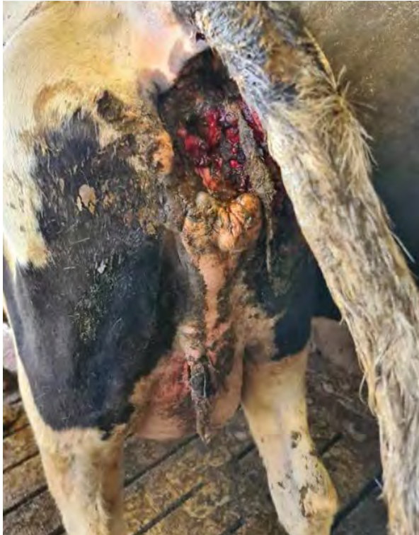
↑ Rund met een grote open en ontstoken wond. De wond omvatte de uitwendige geslachtsdelen, de "natuurlijke openingen van de anus en vulva waren niet zichtbaar en herkenbaar". Woo 24-0534 2024

Een ander veel voorkomende overtreding in de inspectierapporten betreft het vervoeren van dieren met grote, open wonden. De omvang en mate van ontsteking van deze wonden veroorzaken constante pijn en ongemak.