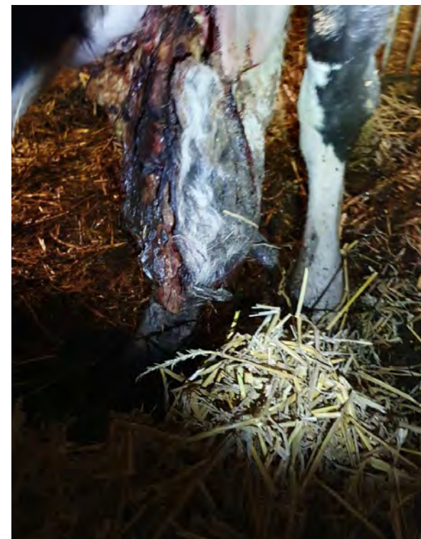
↑ Koe met grote ernstige open wond aan de uier. "Ik zag, dat de beschadiging van de ophangband zodanig was, dat het linker voorkwartier van de uier alleen nog los verbonden was met de koe". Woo 24-0006, 2023.