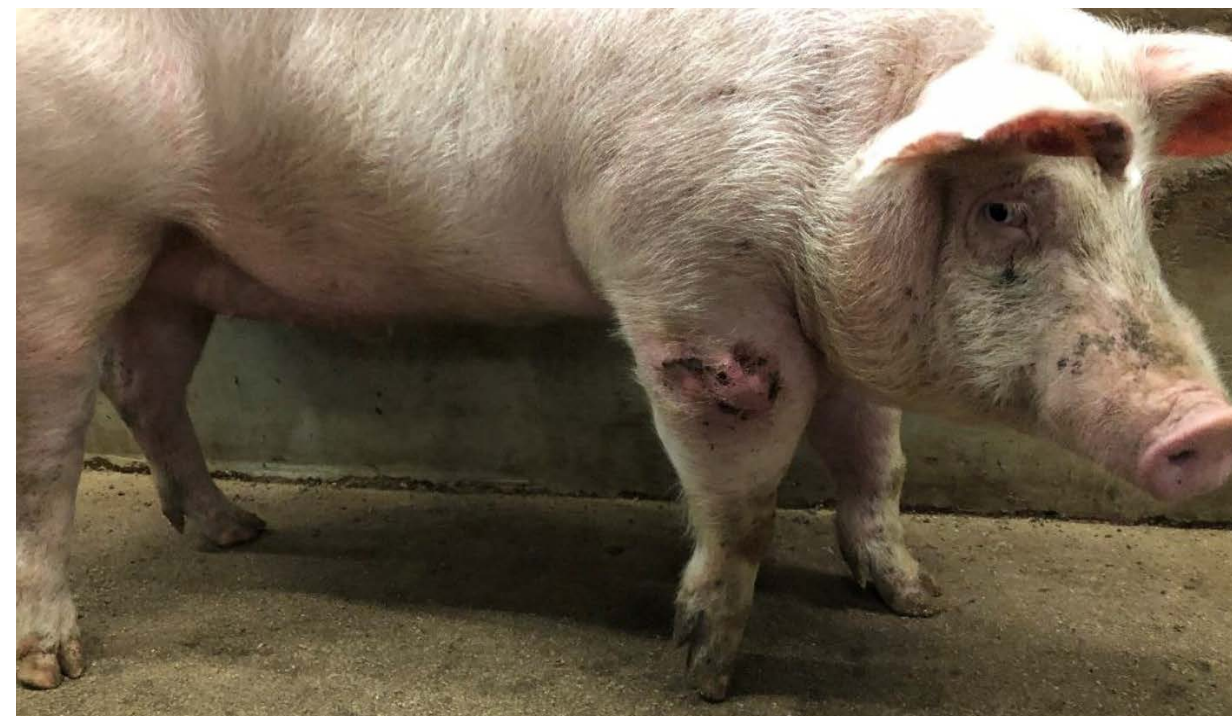
↑ Varken met een abnormaal groot ellebooggewricht. Woo 21-0551, 2021