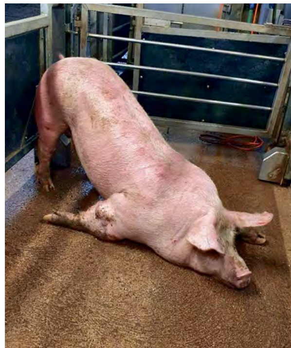
↑ Varken dat door een ernstig ontstoken rechtervoorpoot niet meer kon opstaan. Woo 21-0042, 2020