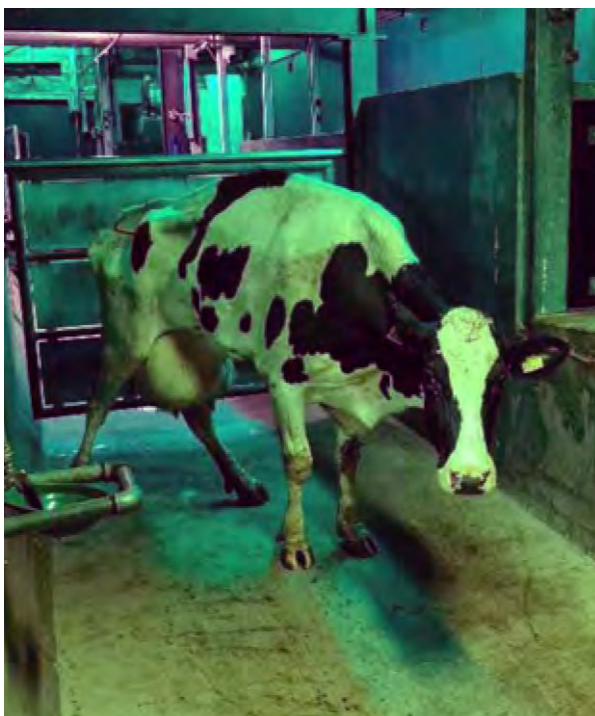
↑ Rund dat beide achterpoten probeerde te ontlasten. Tevens was het dier vermagerd, uitgedroogd en had ligplekken aan beide kanten. Woo 24-0534 2024