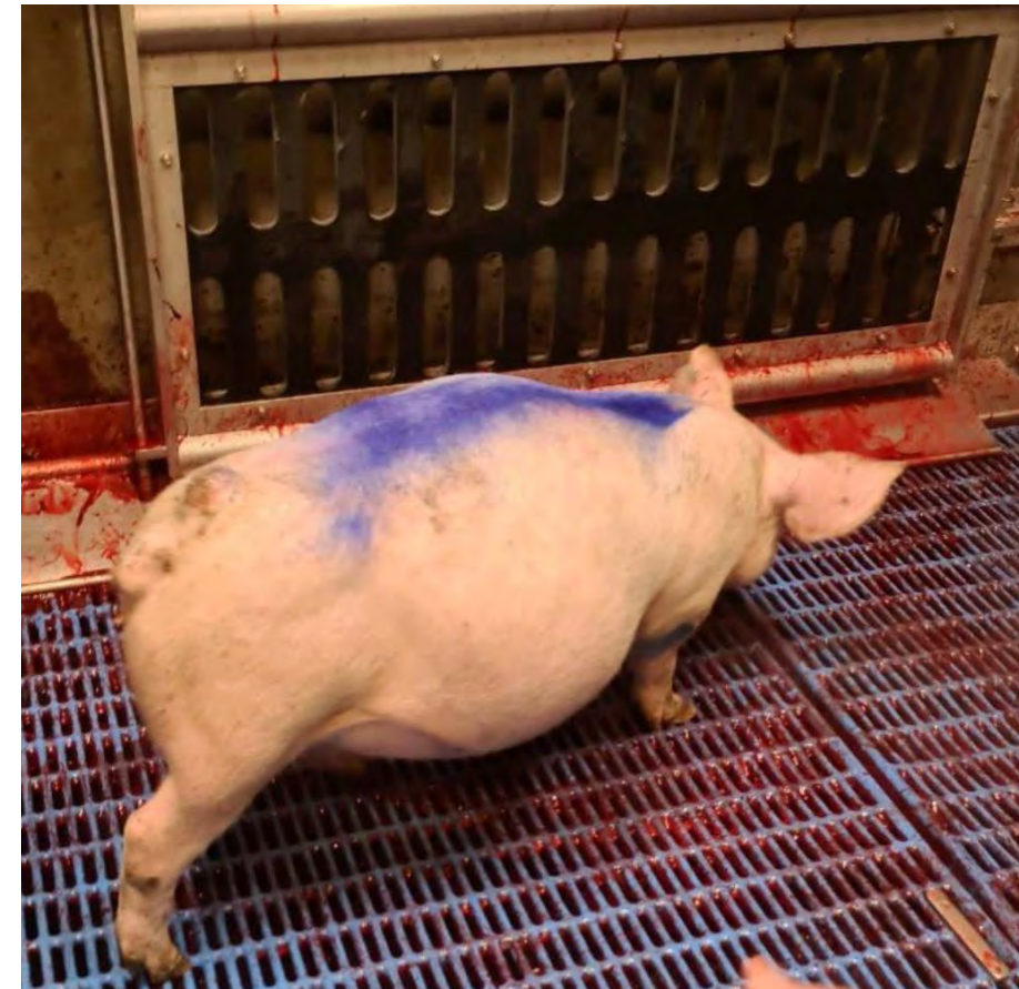
↑ Big met opgezwollen buik, ontstoken staart en 2 abscessen op de rug. Woo 24-0006, 2023

Meerdere dieren komen ernstig ziek aan op het slachthuis. In alle gevallen was deze slechte toestand makkelijk te herkennen en hadden ze nooit op transport gemogen. Zo omschrijft een rapport een varken met hoge koorts, waardoor het varken bij aankomst in het slachthuis gelijk instortte. Een ander varken kwam met een grote opgezwollen buik en ontstekingen in het slachthuis aan.