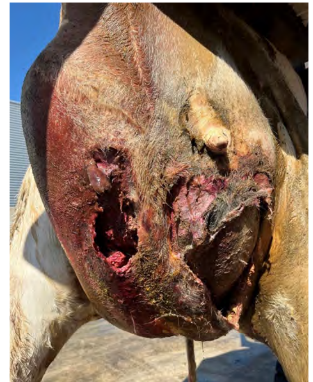
↑ Koe met koorts en ernstig open wond op de uier. "Ik zag dat pus en ontstekingsvocht uit de wond liepen". Woo 24-0006, 2023