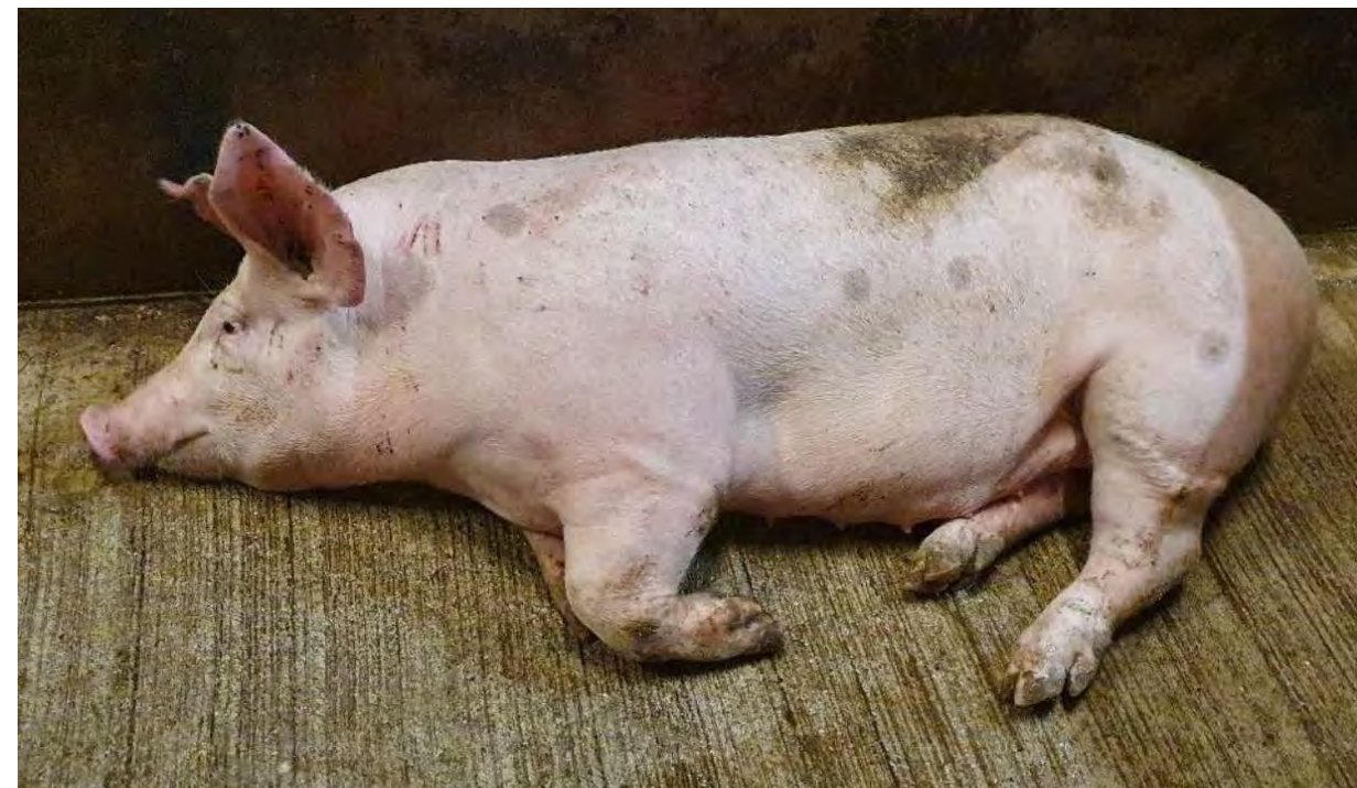
↑ Varken dat na aankomst in het slachthuis in elkaar stortte en niet meer overeind kwam. Woo 21-0042, 2020