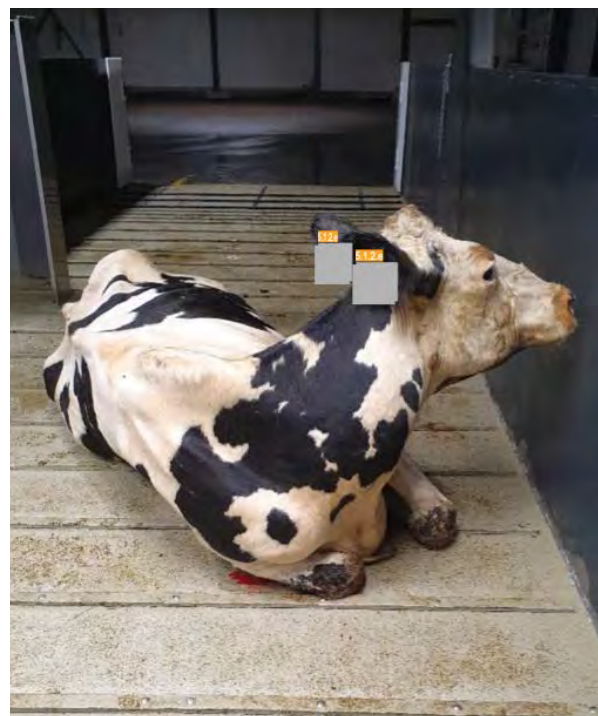
↑ Een rund die door een ernstige ontsteking aan de rechter achterpoot niet meer overeind kon komen. Woo 24-0006, 2023