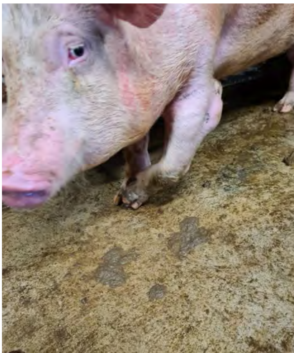
↑ Het varken kon de linkervoorpoot niet meer gebruiken en liep hierdoor op drie poten door. De inspecteur stelt dat het transport naar het slachthuis "erge pijn en lijden hebben gegeven." Woo 24-0006, 2023