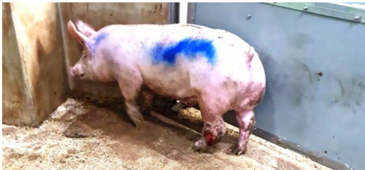
↑ Varken met een open wond op het gewricht van de linkerachterpoot. De wond was al langere tijd ontstoken en zodanig pijnlijk dat het varken niet op deze poot kon staan. Woo 24-0006, 2023